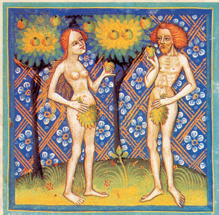
Kremloveský sborník povídek a náboženských skladb: 142b

Záštitu nad výstavou převzali: arcibiskup pražský Mons. Dominik Duka metropolita pražský a primas český, kardinál Miloslav Vlk emeritní arcibiskup pražský, MUDr. Přemysl Sobotka 1. místopředseda Senátu PČR