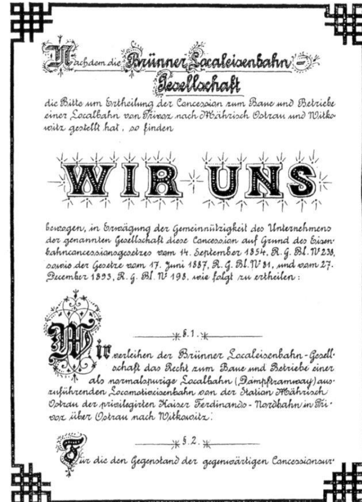
Koncesní listina místní dráhy Přívoz-Vítkovice (1894)