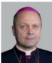
Pomocný biskup Mons. Zdenek Wasserbaeur (2018)