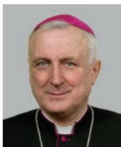
Biskup-apoštolský exarcha Mons. Ladislav Hučko titulární biskup ořejský (2003)

Exarchát vydává dvouměsíční zpravodaj Exarchát a ročenku Řeckokatolický kalendář. Na území Apoštolského exarchátu působí od roku 2008 Řeckokatolická charita a s Apoštolským exarchátem je také spojen Institut sv. Kosmy a Damiána, který je zaměřen na