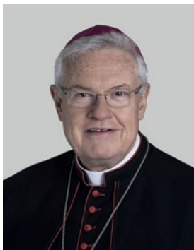
Apoštolský nuncius v ČR J.E. Mons. Charles D. Balvo

Apoštolská nunciatura představuje diplomatické zastoupení Svatého stolce v jednotlivých zemích.