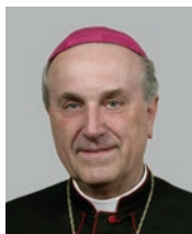
Emeritní biskup Mons. František Radkovský 1. plzeňský biskup (1993)