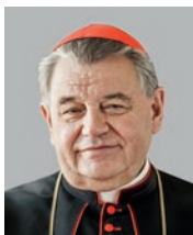
Arcibiskup kardinál Dominik Duka OP 36. pražský arcibiskup (2010)