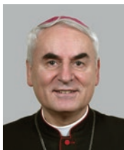
Diecézní biskup Mons. Vojtěch Cikrle 13. brněnský biskup (1990)