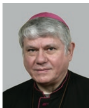
Pomocný biskup Mons. Václav Malý (1997)