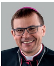
Diecézní biskup Mons. Tomáš Holub 2. plzeňský biskup (2016)