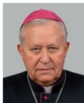
Emeritní pomocný biskup Mons. Ján Eugen Kočiš titulární biskup abrittský