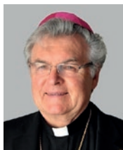
Emeritní pomocný biskup Mons. Petr Esterka