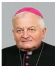
Emeritní pomocný biskup Mons. Karel Herbst, SDB (2002)