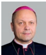
Pomocný biskup Mons. Zdenek Wasserbaeur (2018)