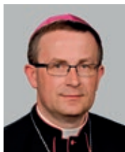
Apoštolský administrátor sede plena et ad nutum Sanctae Sedis