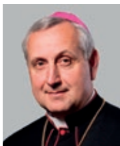
Diecézní biskup Mons. Vlastimil Kročil