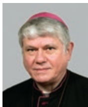
Pomocný biskup Mons. Václav Malý (1997)