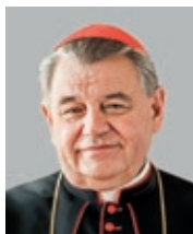
Arcibiskup kardinál Dominik Duka, OP 36. pražský arcibiskup (2010)