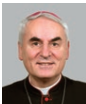
Diecézní biskup Mons. Vojtěch Cikrle 13. brněnský biskup (1990)