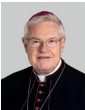
Apoštolský nuncius v ČR J. E. Mons. Charles D. Balvo

Apoštolská nunciatura představuje diplomatické zastoupení Svatého stolce v jednotlivých zemích.