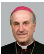
Emeritní biskup Mons. František Radkovský 1. plzeňský biskup (1993)