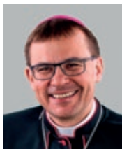
Diecézní biskup Mons. Tomáš Holub 2. plzeňský biskup (2016)