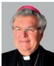
Emeritní pomocný biskup Mons. Petr Esterka (1999)