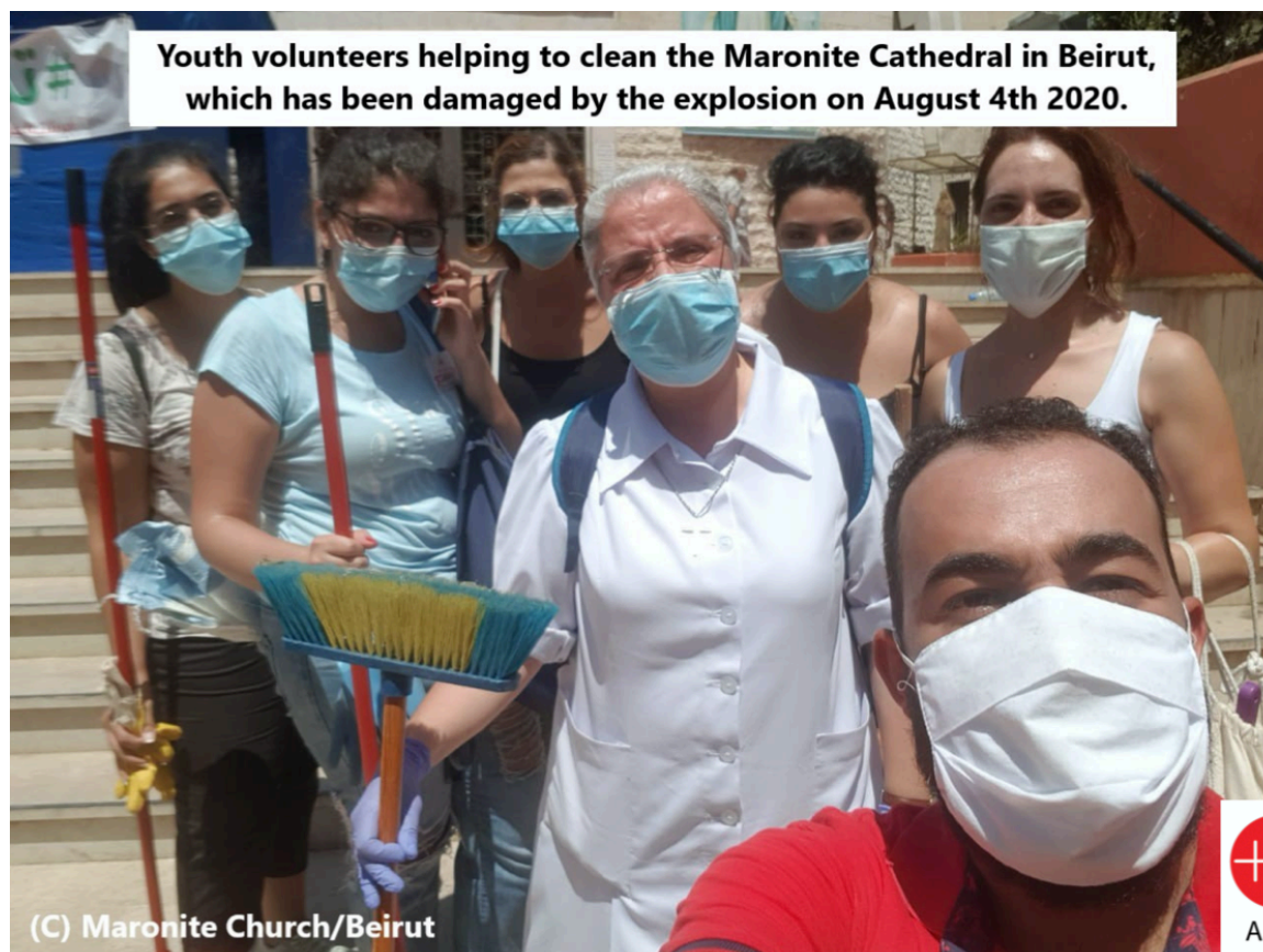
Foto: Mladí dobrovolníci pomáhají vyklidit maronitskou katedrálu v Bejrútu, poškozenou výbuchem 4. srpna 2020