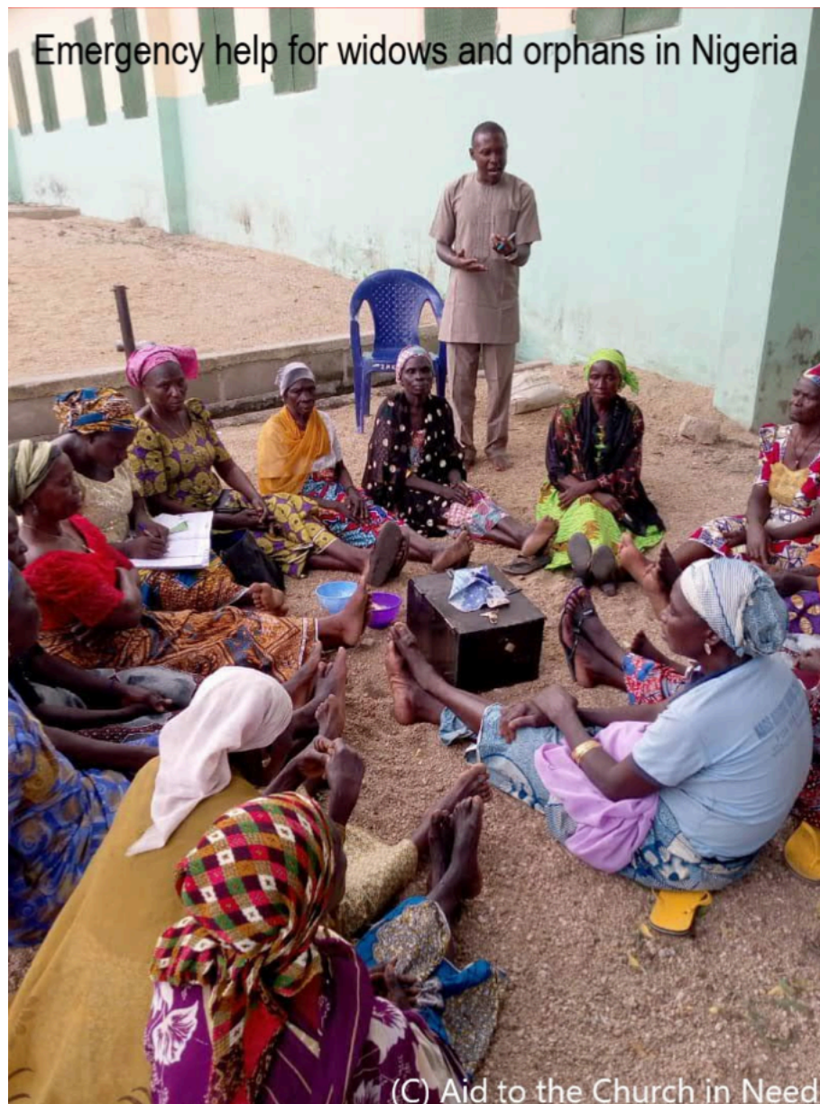
Foto: Humanitární pomoc vdovám a sirotkům v Nigérii